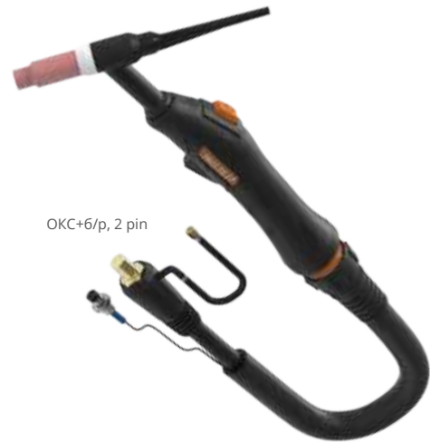
ОКС+6/p, 2 pin